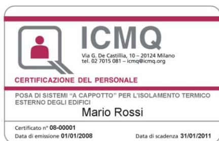
ESEMPIO DI CERTIFICATO INTESTATO A PERSONA SINGOLA