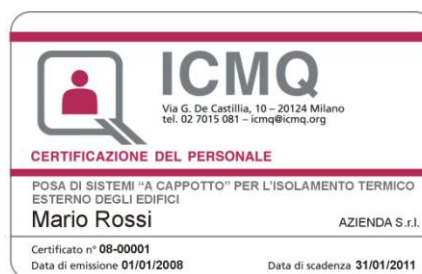
ESEMPIO DI CERTIFICATO INTESTATO A PERSONA E AZIENDA